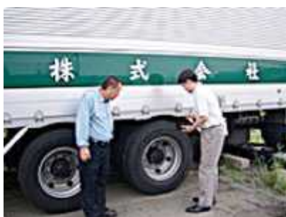
収集運搬会社 現地確認

アマタでは、全国の収集運搬会社、ユーザー企業と協業しています。各社の現地確認やご担当者様との合同勉強会を通じて、現場のリスクや最新情報を共有、パートナー企業と共にリスクゼロに向けての体制を築いています。