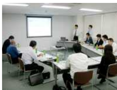
パートナー企業との合同勉強会